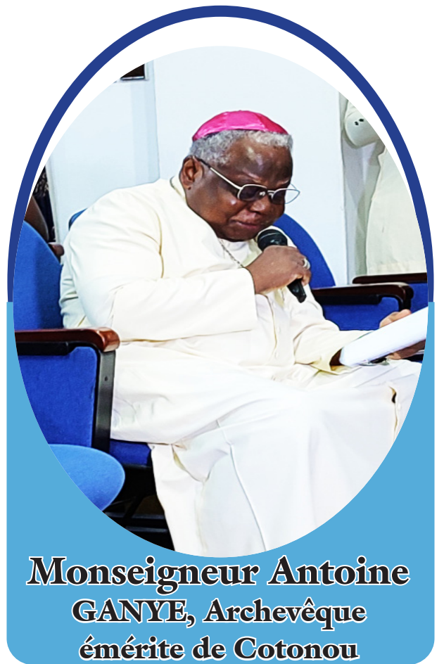
Monseigneur Antoine GANYE, Archevêque émérite de Cotonou